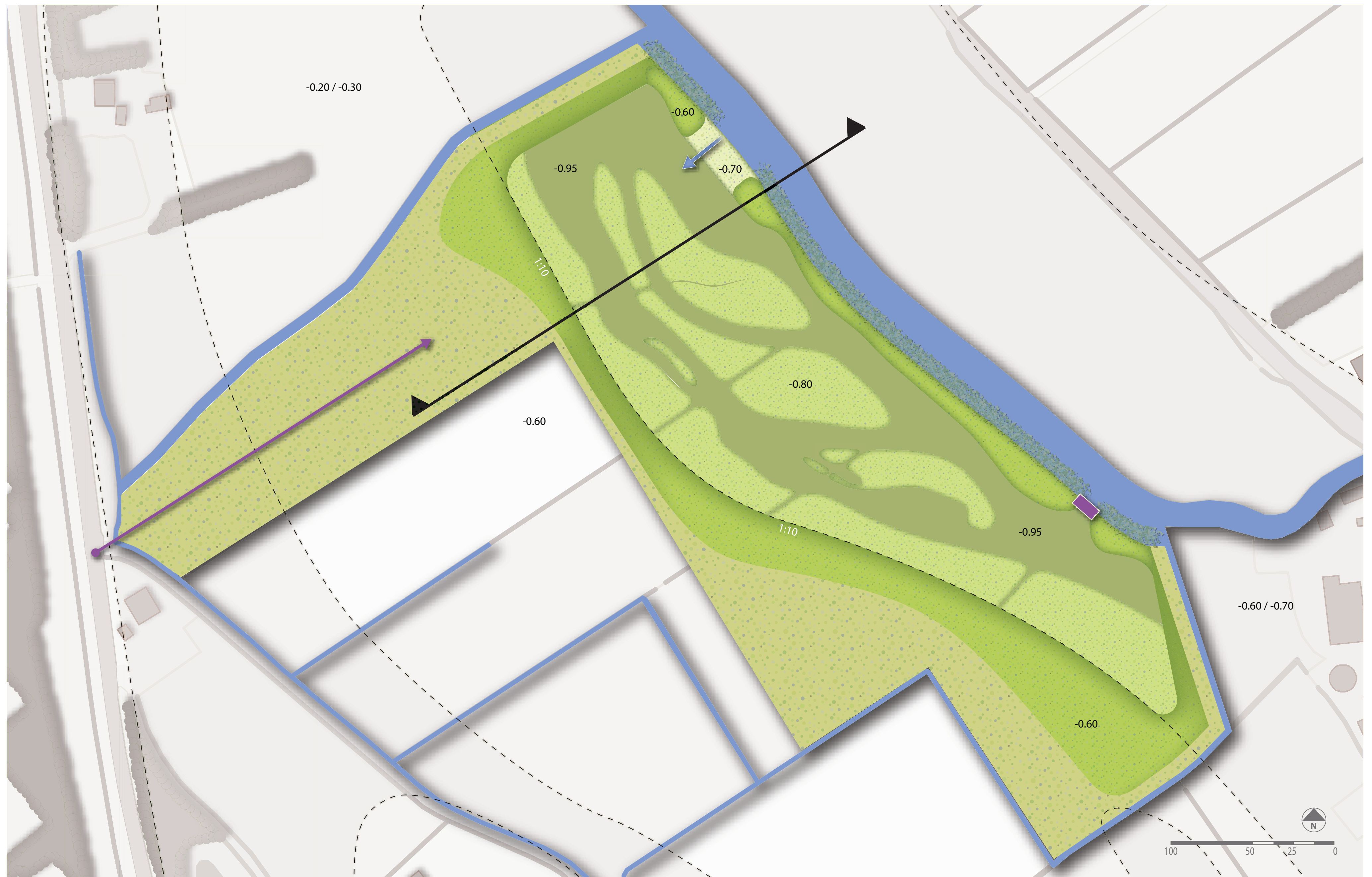
Boven: plankaart deelgebied 2, onder: principeprofiel deelgebied 2